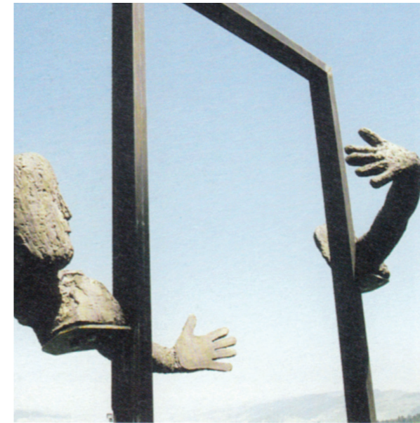
Bsp. bildStock: Paul Louis Meier

Die Idee der künstlerischen Inszenierung der Orte, welche als Phase 4 (2017-2018) anvisiert ist, kommt daher, dass die Projektgemeinschaft den Inhalt der Rahmen im Laufe der Jahre in Eigenregie immer wieder neu gestalten möchte, um die Kommunikation der Religionsgemeinschaften untereinander und den Dialog mit den Menschen in der Landschaft immer wieder neu anzuregen. Sind die „Bildstöcke“ anfangs noch gerahmte Blicke, so werden sie in Zukunft zu Trägern eigener meditativer Bildwelten umgestaltet.